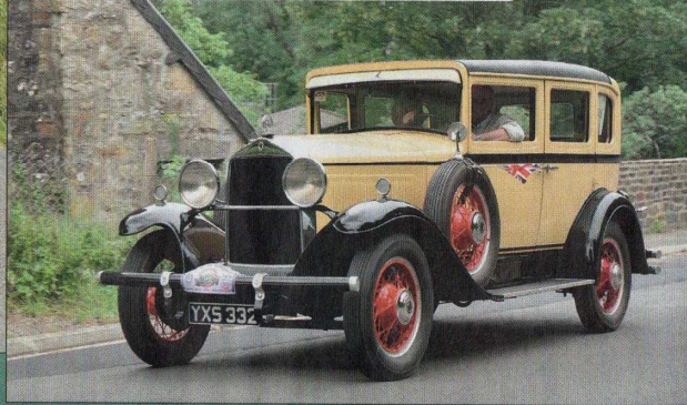
▲ Ce collectionneur anglais roule avec une Willys Knight de 1931 visible dans le film Bonnie & Clyde d'Arthur Penn en 1967.