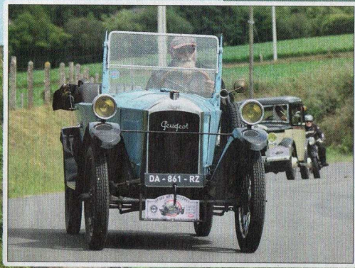
◀ La petite Peugeot Quadrillette a du mal à graver les côtes !